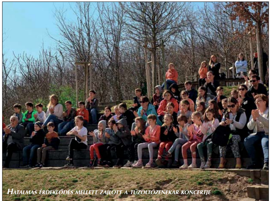
HATALMAS ÉRDEKLŐDÉS MELLETT ZAJLOTT A TŰZOLTÓZENEKAR KONCERTJE