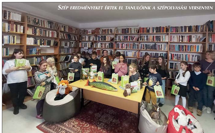
SZÉP EREDMÉNYEKET ÉRTEK EL TANULÓINK A SZÉPOLVASÁSI VERSENYEN

Március 22-én, kedden az alsós komplex tanulmányi verseny zajlott Sós-kúton, ahol összemérhették tudásukat tanulóink a sós-kúti iskolában tanuló évfolyamtársaikkal. Az igazán nehéz versenyen az alábbi nagyon szép helyezések születtek: