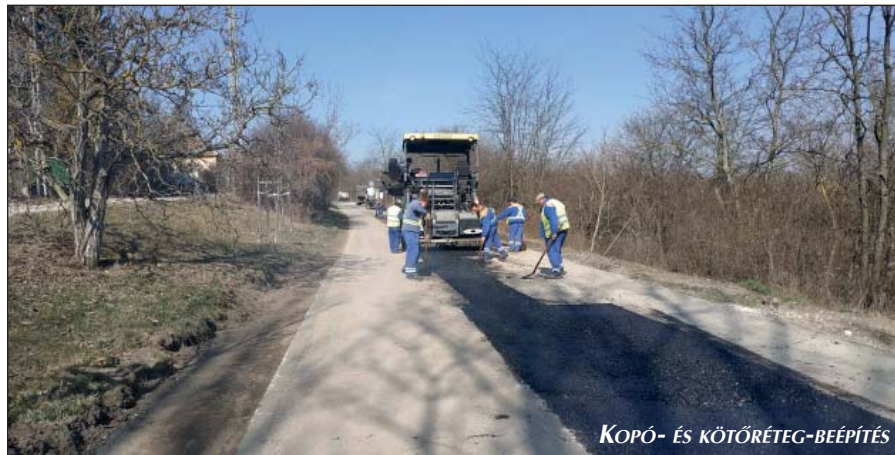
KOPÓ- ÉS KÖTŐRÉTEG-BEÉPÍTÉS

A minisztérium támogatói döntésről küldött értesítője alapján a Magyar Falu Program keretében 2021-ben meghirdetett, Út, híd, kerékpárforgalmi létesítmény építése/felújítása – 2021 című, MFP-UHK/2021 kódszámú pályázatra benyújtott anyagunk