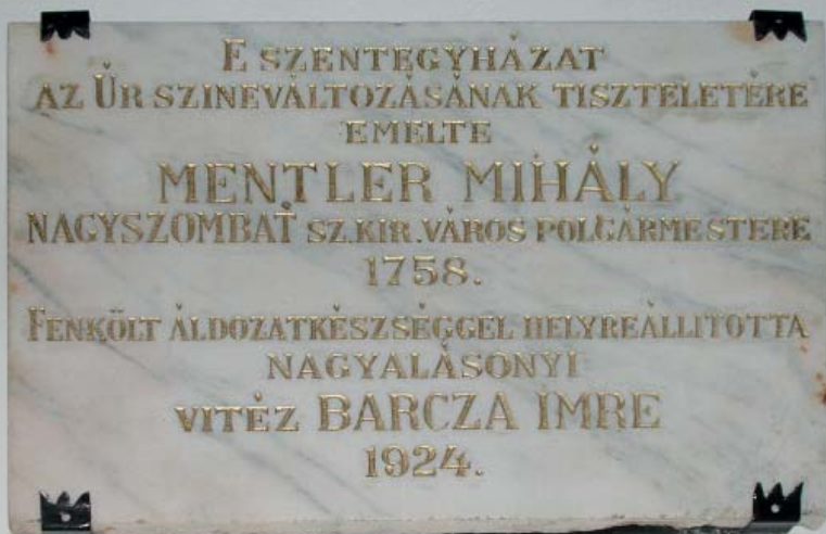
AZ ÚJRAARANYOZOTT EMLÉKTÁBLA