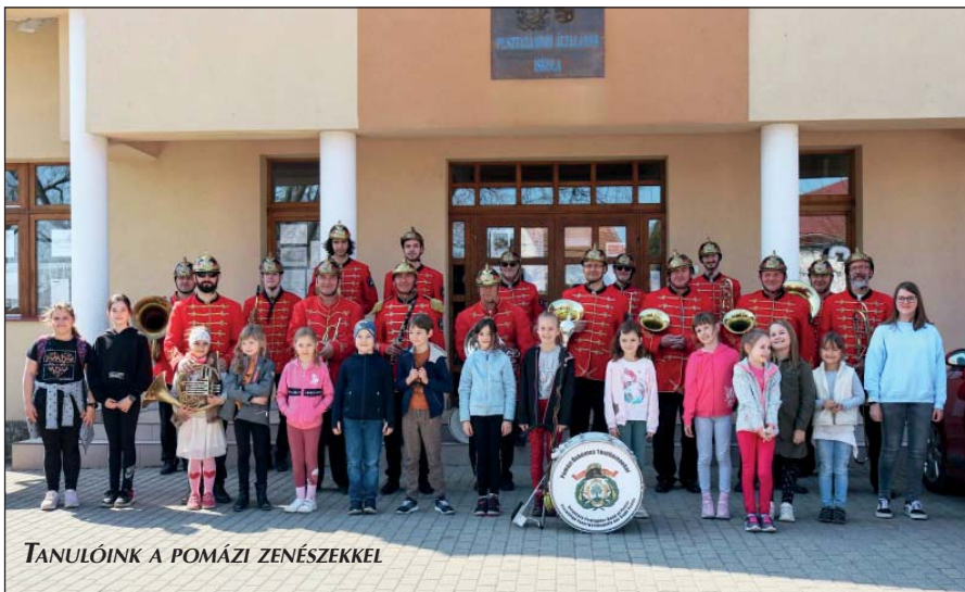
TANULÓINK A POMÁZI ZENÉSZEKKEL