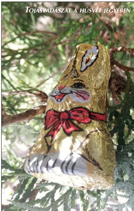
TOJÁSVADÁSZAT A HÚSVÉT JEGYÉBEN