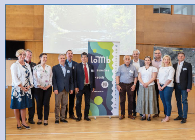
Térségi közös fellépés a fenntartható jövőért (7. old.)