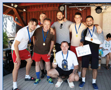
Biró Csaba Emlékkupa (13. old.)