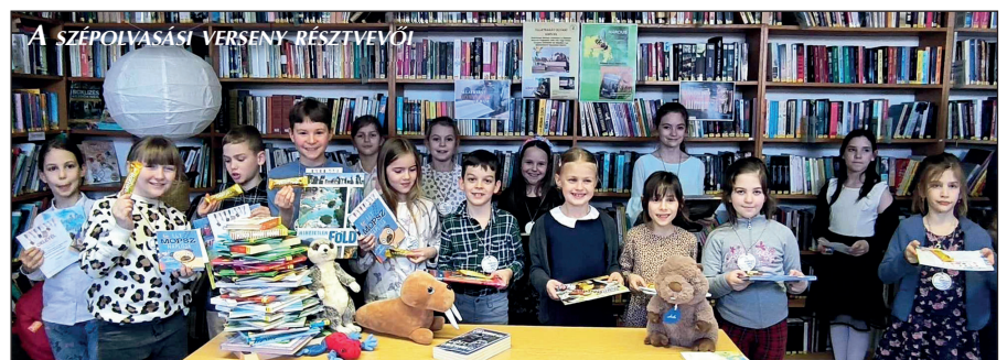
A SZÉPOLVASÁSI VERSENY-RÉSZTVEVŐI