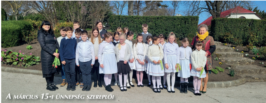
A MÁRCIUS 15-I ÜNNEPSÉG SZEREPLŐI