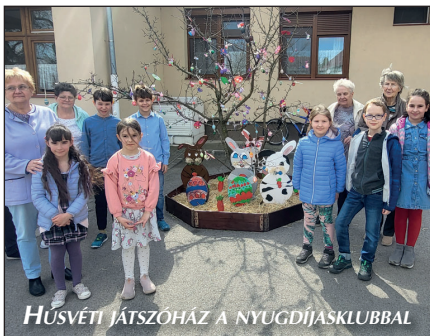
HÚSVÉTI JÁTSZÓHÁZ A NYUGDÍJASKLUBBAL

Köszönjük Pusztazámor Községi Önkormányzatának a támogatást, amelynek köszönhetően minden kis-